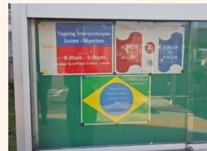
(多治見公共職業安定所、庁舎外の掲示版) 外国人雇用サービスコーナーをタガログ語、英語、ポルトガル語で表記