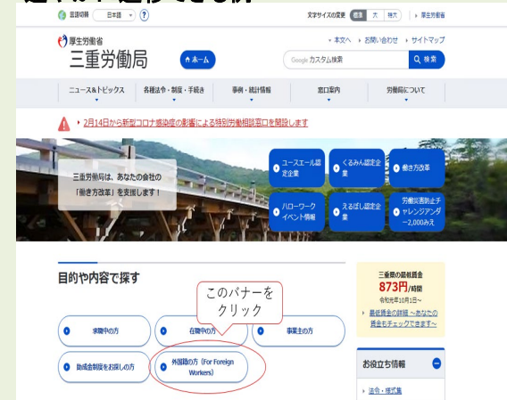
（三重労働局HPのトップページ）