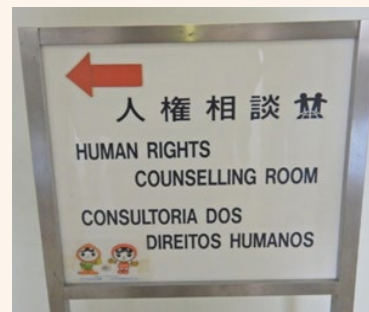
(名古屋法務局 庁舎4階案内表示) 外国人のための人権相談を英語、ポルトガル語で表記