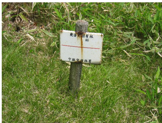
文字が薄れ判読不能となった標識 (平成 19 年末までに処置済) (茶ノ木平自然観察教育林)