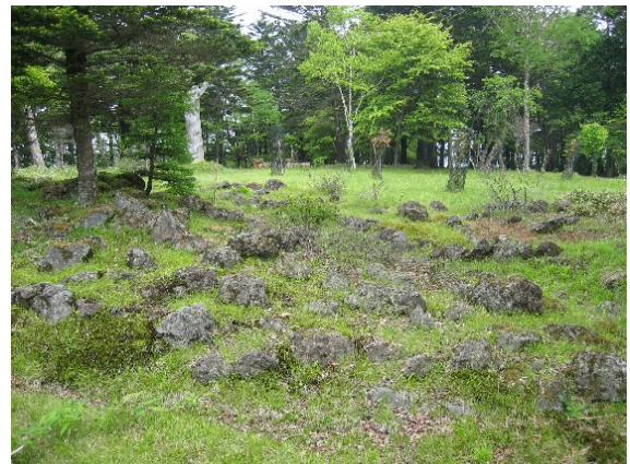
廃止されたロックガーデン。ロープウェイが廃止され入込客が減少した。