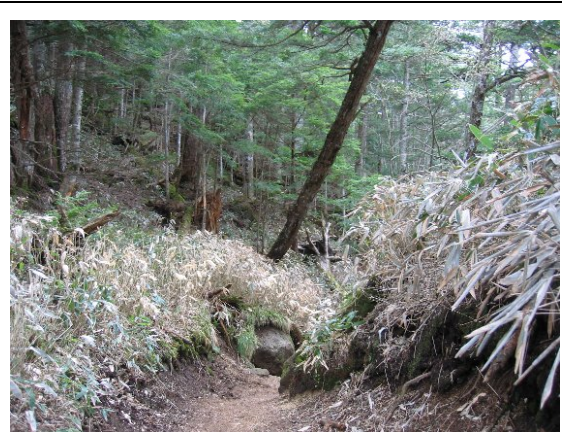
歩道に樹木が倒れかかっている (切込・刈込湖自然観察教育林)