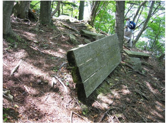
ベンチが倒壊して使用不能になっている (中禅寺湖南岸自然観察教育林)