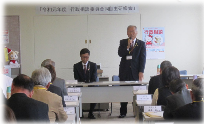
委員合同自主研修会で進行を務める委員