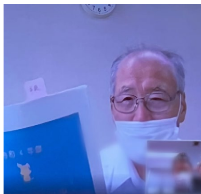
<三好市役所会議室>