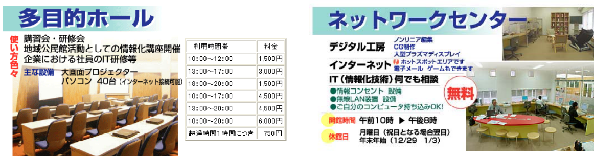
図表 茅野市情報プラザ（諏訪東京理科大学内）