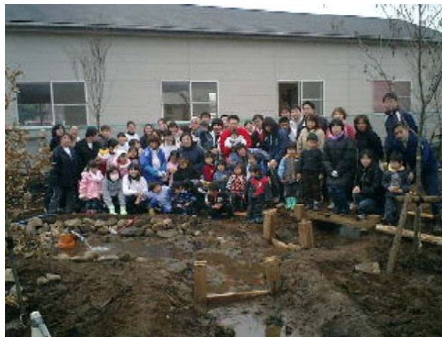
図表 ビオトープ整備の様子

※ NPO グラウンドワーク三島は、市民・行政・企業の三者の中核に存在する「専門性の高い仲介役的な NPO」の組織づくりをめざしており、上記の各事業も、それぞれ NPO グラウンドワーク三島に参加している 20 の団体との連携の下に進められている。