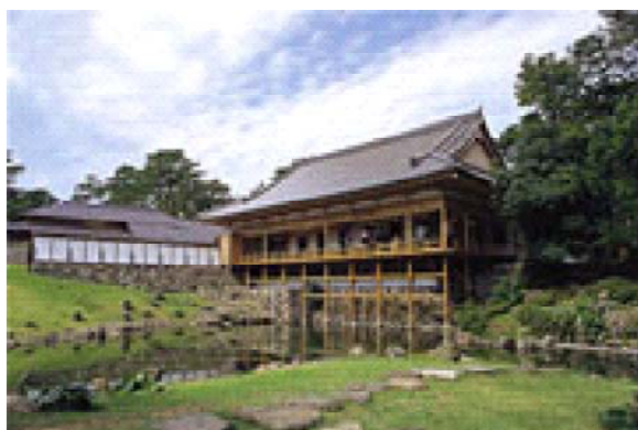
小倉城庭園