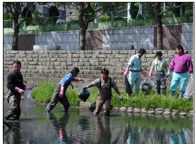
⇧地域力で取り組む河川美化活動