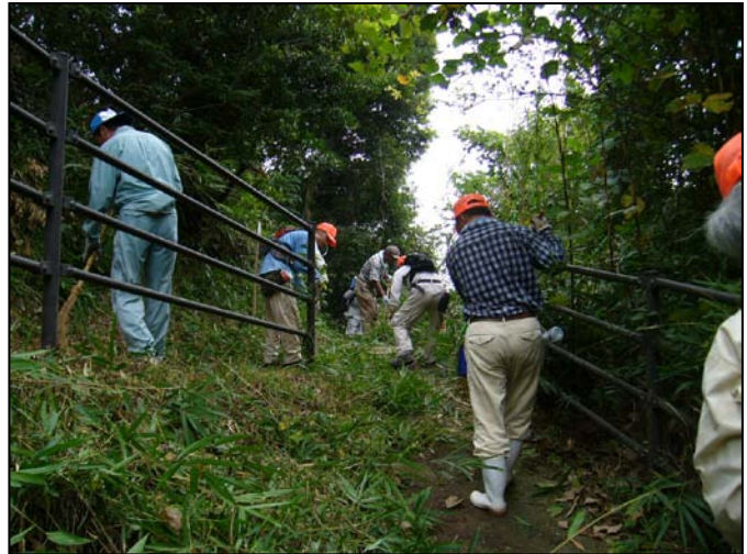
⇩草刈り作業の様子

このような現状を踏まえ、これらの集落の機能を維持するため、集落で単独で実施することが困難となった各種共同作業をボランティアで支援する「中山間盛り上げ隊」を組織し、中山間地域の集落等からの要望に応じて隊員を派遣する「中山間盛り上げ隊派遣事業」を実施することとした。