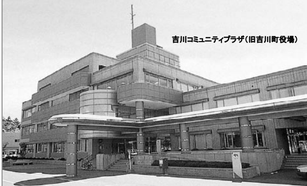
吉川コミュニティプラザ(旧吉川町役場)