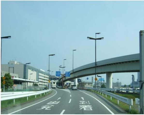
①第2ゲートから第2ターミナル方面へ進んだところ