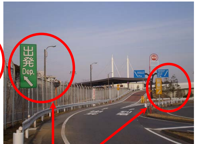
補助看板設置か所

【連絡先】 総務省 関東管区行政評価局総務部首席行政相談官室 電 話 : 048-600-2310