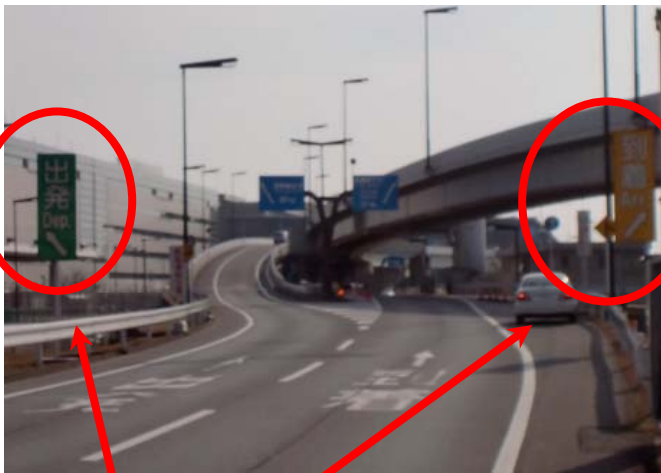
補助看板設置か所