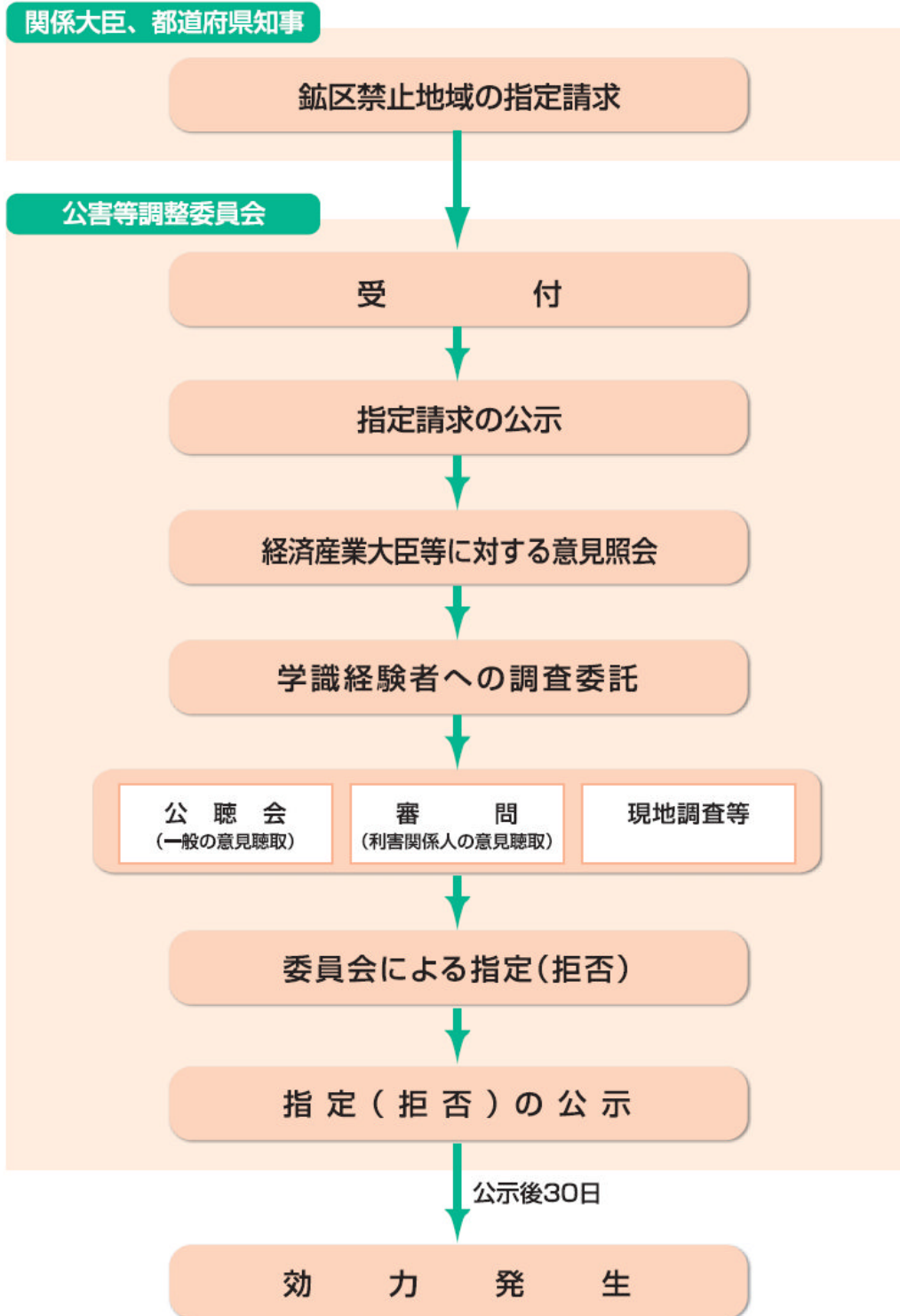
図 3 - 1 - 1 鉱区禁止地域の指定制度