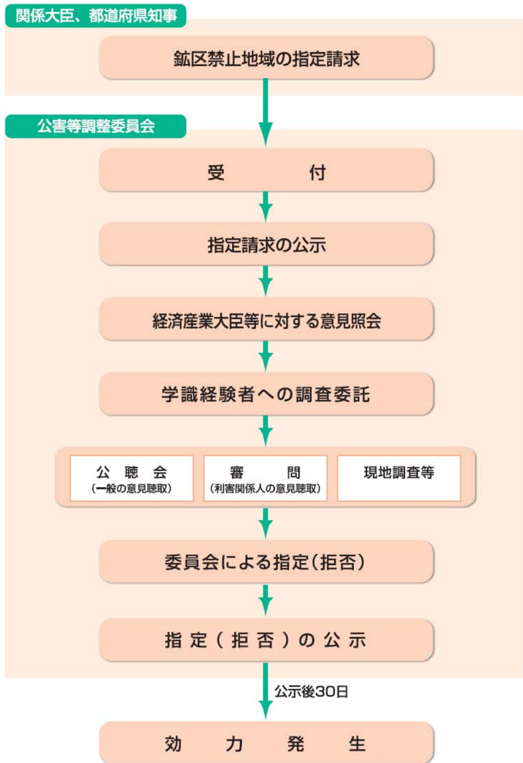
図 2 - 1 - 1 鉱区禁止地域の指定制度