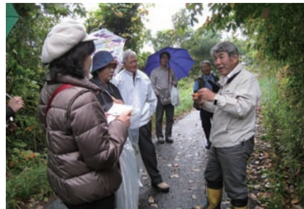
山野草の可能性を模索する美郷薬草研究会のメンバー、薬草の専門家を定期的に招き商品開発等の研究を行っている。

このように、地域住民や自治体等と連携しながら、地域資源を積極的に活用した先駆的な取組みを展開することで、過疎地域の活性化に大きな成果をあげている点が評価された。