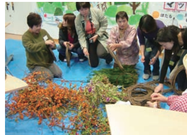
体験インストラクター指導による山の副産物かすら等を使用した自分だけのオリジナルの装飾品づくりが体験できる。(春夏秋冬365体験メニュー)