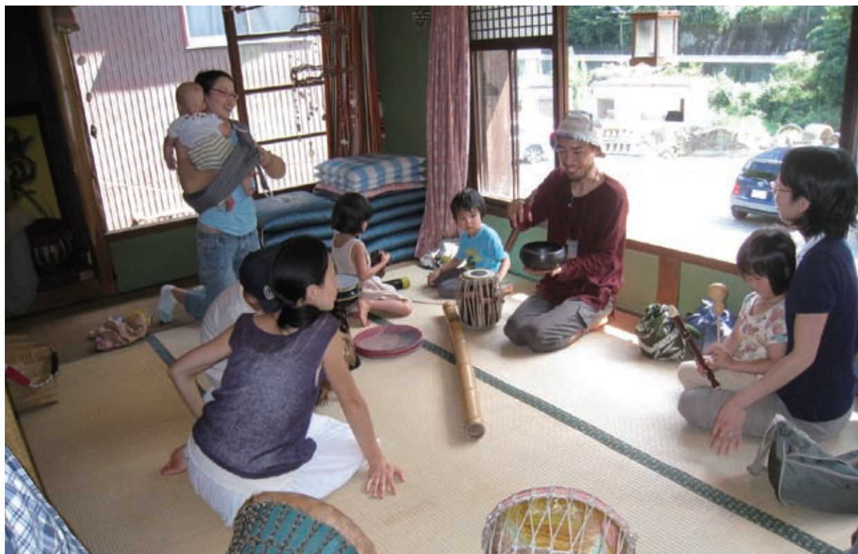
美郷地区は、日常生活では味わうことのできない癒しとスローライフを求める若者グループの来訪者が増加。(アフリカ太鼓ジャンベ等の演奏体験を楽しんでいる来訪者。)