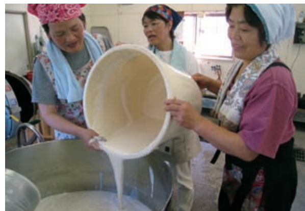
美郷の農業の担い手の中心である主婦グループによる地域資源を活用した特産品の研究開発、地域に根ざす女性の知恵と努力のたまものである。