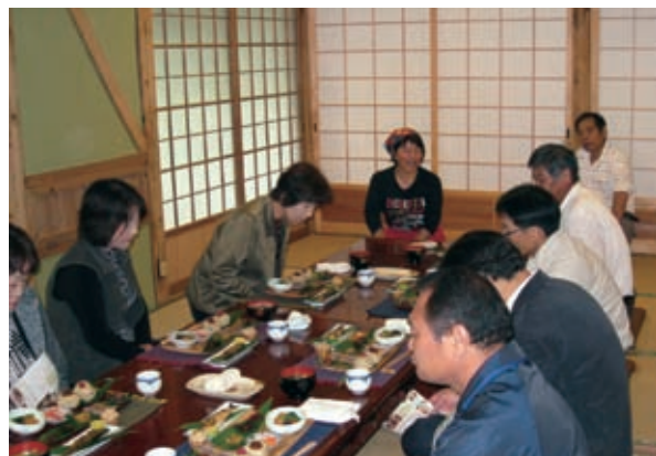
農家民宿や農家レストランでは、季節の地元食材を使用した美郷流マクロビオティック料理を堪能することができ、ゆったりとしたなか時間による相乗効果で心身共にリフレッシュ。(美郷流マクロビオティック料理を堪能している来訪者。)