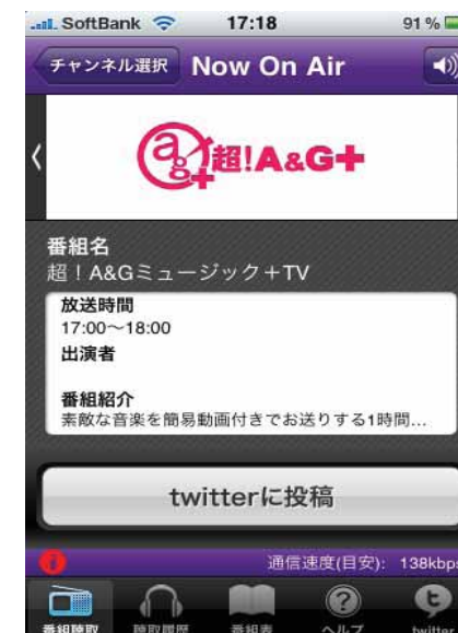
iPhoneアプリ kikeru radio