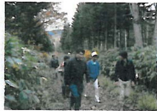
森林ウォーキング体験 *イメージ写真