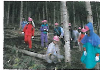
林業体験(間伐体験) *イメージ写真