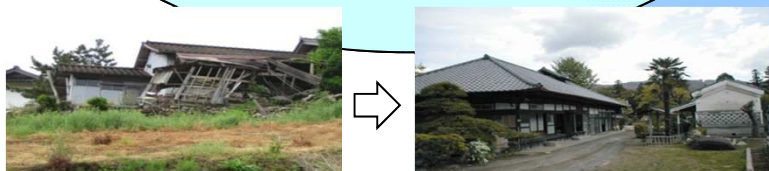
定住促進空き家活用事業