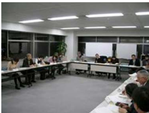
多文化共生連絡会の様子

新宿区は、2011年度に外国人が区政に参画する仕組みづくりのため「(仮称)新宿多文化共生推進会議」の制度設計を行う。また、外国にルーツを持つ子どもの学習支援・生活支援に取り組むための基礎資料を得ることを目的として実態調査を実施する。これらの施策は、区長のマニフェスト(2010年11月～2014年11月)にも掲げられている 6 。