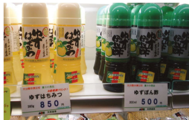
ゆず商品は、大好評。特にモンドセレクション特別金賞を受賞したゆずはちみつは、世界的にも評価が高い。