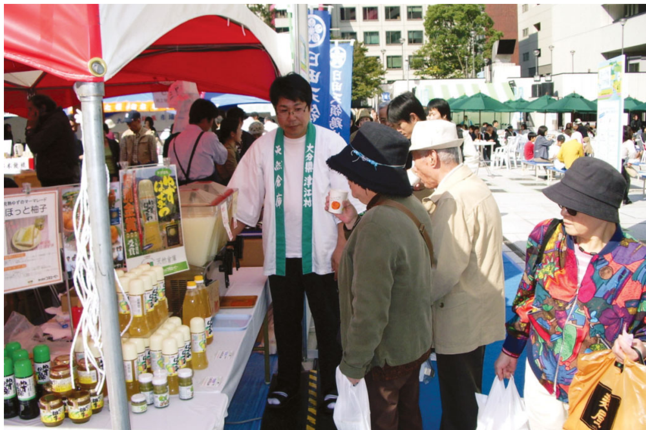
福岡都市圏の交流物産展での販売の様子。