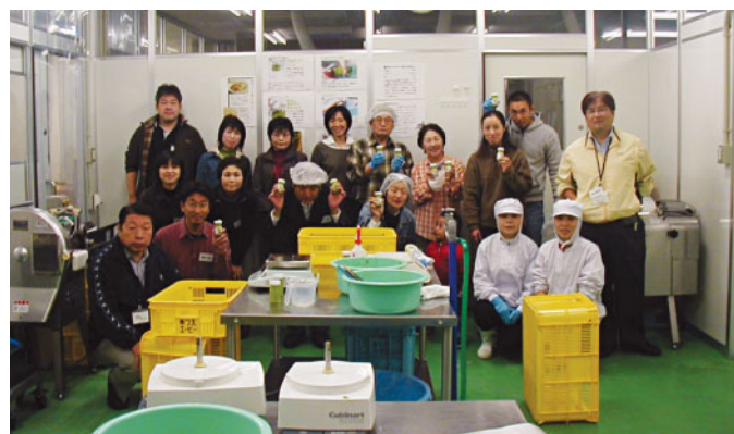
ゆずこしょう加工体験と併せた工場見学会を開催。