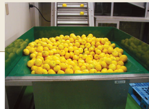
ゆずの加工の様子。