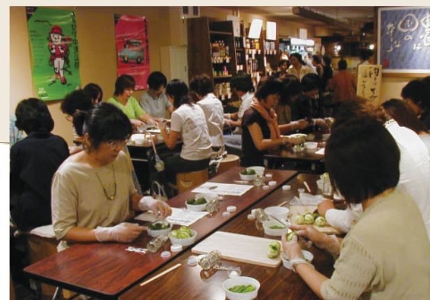
ゆずこしょうづくり体験の様子。

このように本事例は、地域の特産品を活かした地場産業の創出と地元雇用の受け皿として役割を果たし、地域づくりに貢献しているものとして評価された。