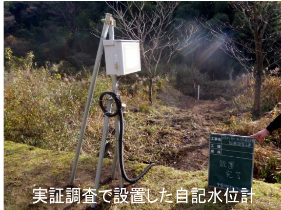
実証調査で設置した自記水位計