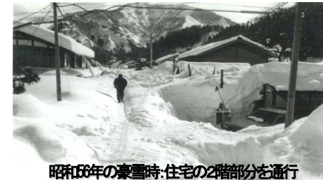
昭和11年の豪雪時、住宅の2階部分を通行