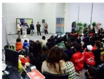
ダンス発表会（市民主催）