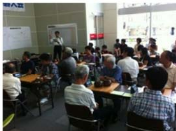
ケーブルテレビ囲碁大会（自社主催）