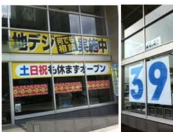
地デジ相談と地デジカウントダウン