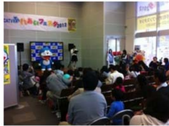
ふれあいフェスタ（自社主催）