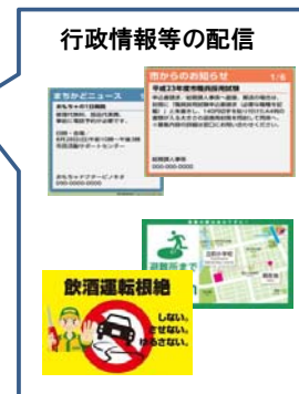
情報配信方法の例