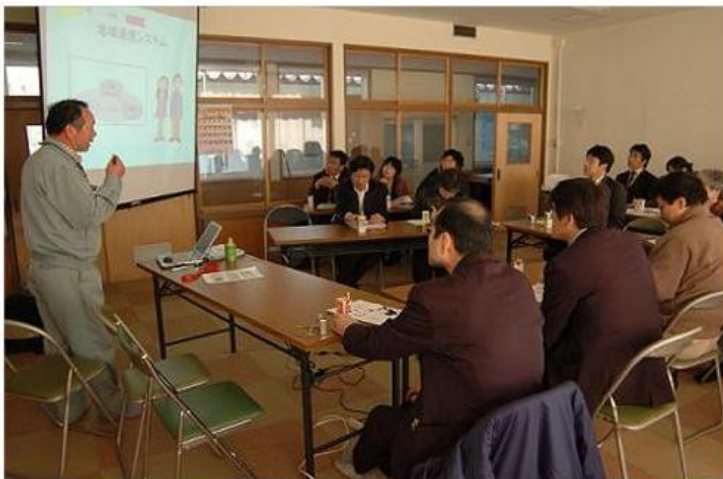
「国土施策創発調査」成果報告会 現地交流会 作木町分科会