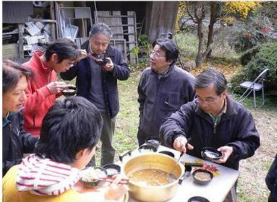
ひろしまね秋の味の会 「つがにもくづ蟹のつぶし汁」パーティー

普通に暮らす人が、大事にされる地域をつくりたいと思っています。生活者の視点を改めて大事にし、現場にたつての地域づくりをこれからも大事にしたいと思っています。その一方で、地域の意思決定、合意の形成など地域の自治に関わる部分が、重要な要素になってきました。新たな時代の仕組みづくりや、運用など具体的な提言と実証実験で明らかにして行きたいと思っています。