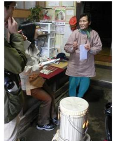
高齢者家庭悉皆調査 (広島県三次市)