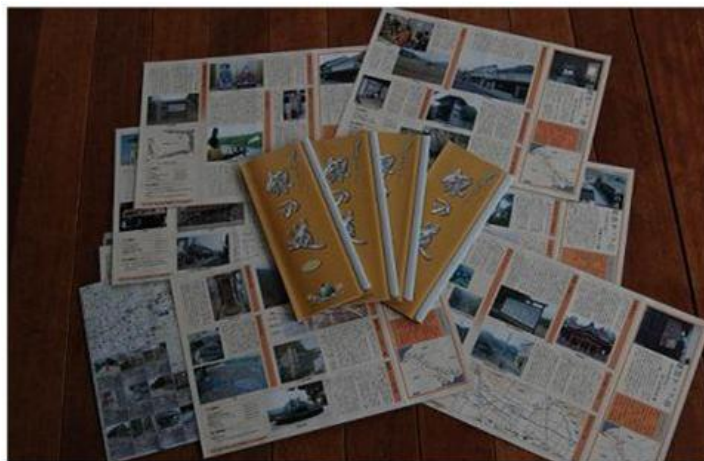
世界遺産指定石見銀山調査の成果物「街道マップ」