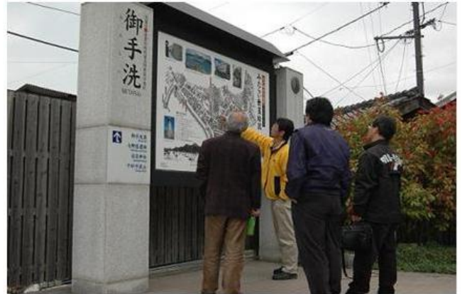
春の巡検(広島県呉市御手洗伝建地区)