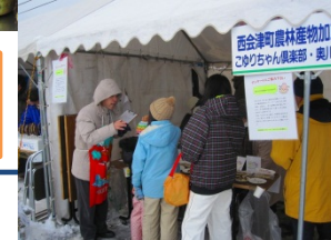
イベントでの販売・モニタリング調査