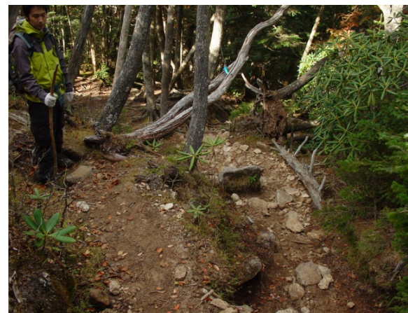
金峰山への登山道