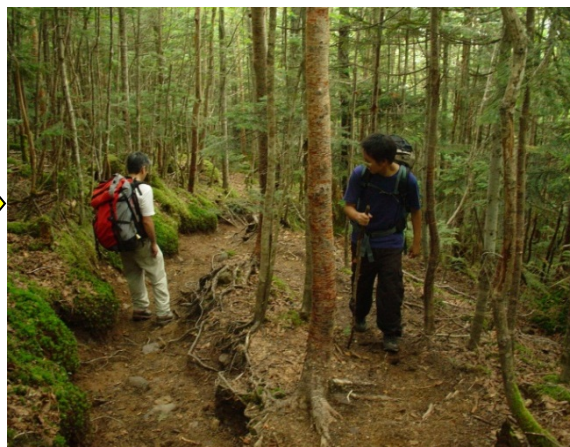
千曲川源流歩道(甲武信ヶ岳主稜線付近)

秩父多摩甲斐国立公園における「甲武信ヶ岳～雁坂峠」及び「金峰山～瑞牆山」にかけての稜線上