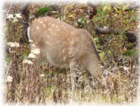
戦場ヶ原シカ侵入防止柵の内・外

シカ侵入防止柵内では植生の回復傾向や柵で囲まれた区域内に生息するシカの頭数の減少がみられる。なお、一部関係機関によれば、当該柵外ではシカによる食害が広範に発生していると説明