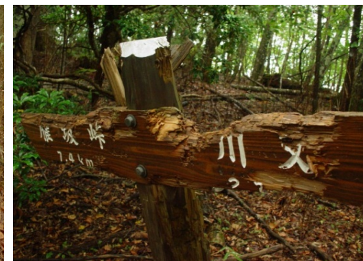
クマの仕業と思われる標識の損傷 (秩父市川又から雁坂峠への登山道)