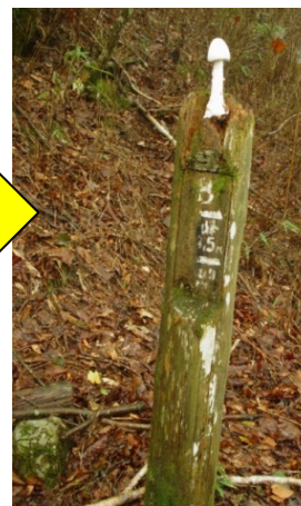
標識の腐朽(三峰から雲取山への登山道)

※4国立公園とは、日光国立公園、尾瀬国立公園、秩父多摩甲斐国立公園及び富士箱根伊豆国立公園をいう。