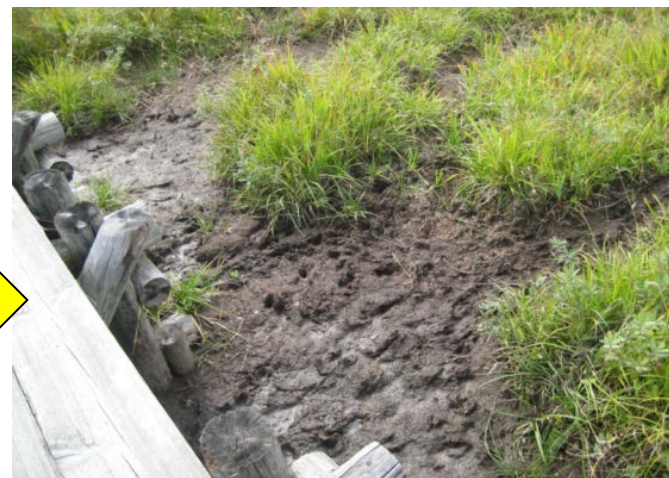
シカの食害による湿原の裸地化(尾瀬ヶ原)

(注) 夜間活動するシカの個体数などを把握するために、木道を歩きながらライトでシカの目を光らせて個体数をカウントする調査