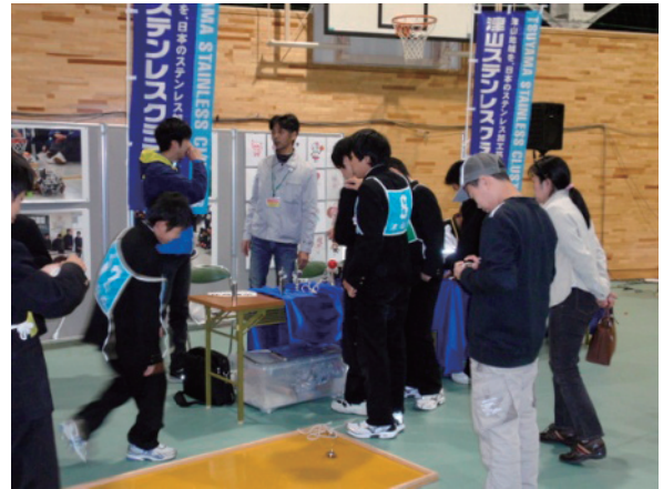
津山口ボコンへの参加

た地域の創造に寄与することを目標としている。リーディング産業を支援し企業の経営力を向上させることで、雇用の創出や税収の確保、さらには地域産業への波及が期待できる。