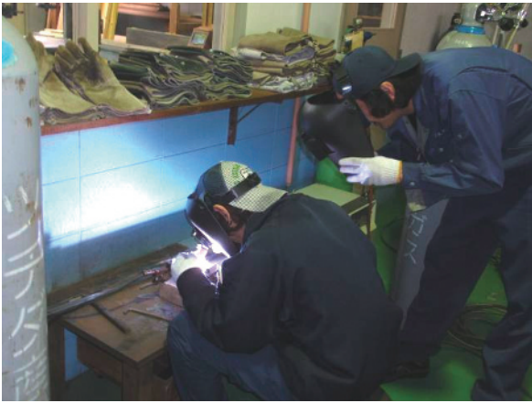
溶接技術教育風景