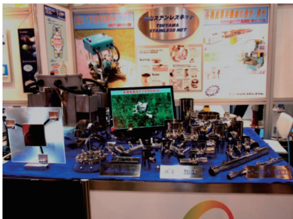
機械要素技術展(東京ビッグサイト)への出展