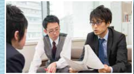
打ち合わせ中の筆者

行政の基本となる法律の改正を任せられ、国際的にも通用する素養を体得し実践できる。こんな総務省という職場で、日本の将来を創る仕事、一緒にやりませんか。