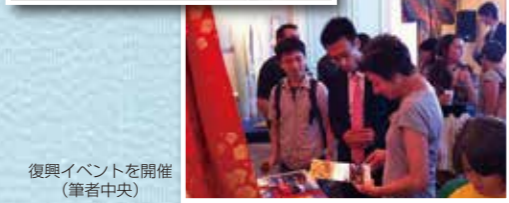
復興イベントを開催(筆者中央)