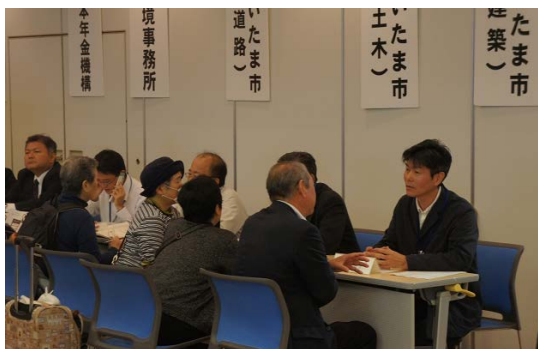
昨年(さいたま市)の相談所の様子

埼玉県内では、春日部市のほか、さいたま市(10月17日)、川口市(12月13日)でも一日合同行政相談所を開設いたします。