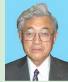
ささき たけし 佐々木 毅 氏 (公社)国土緑化推進機構理事長

1942年秋田県生まれ。東京大学法学部法学博士号取得。専門は政治学・政治学史。東京大学法学部長、同大学大学院法学政治学研究科長、同大学総長等を経て、2013年3月まで学習院大学法学部教授。2005年紫綬褒章受章。総務省「定住自立圏構想の推進に関する懇談会」座長、同省「常時啓発事業のあり方等研究会」座長、(財)明るい選挙推進協会会長等を務める。著書に『民主主義という不思議な仕組み』