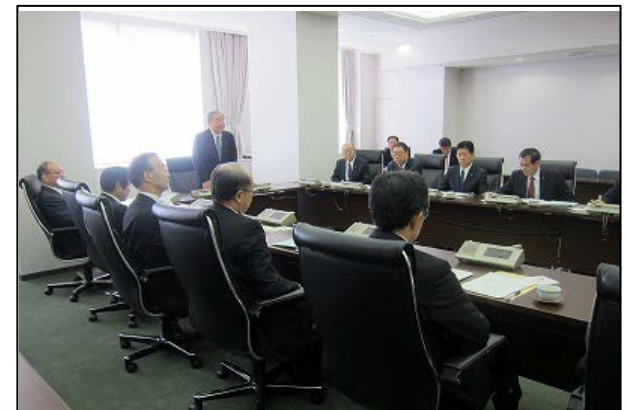
研修のようす(福岡県久留米市)