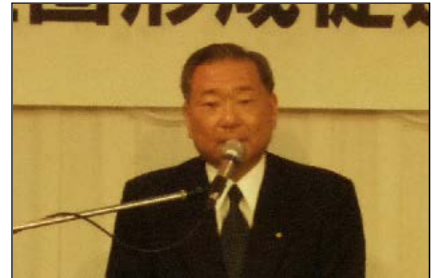
発起人代表あいさつ(設立総会)