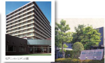
ニッセイエデンの園

ニッセイエデンの園は、有料老人ホーム、疾病予防運動センター、高齢者総合福祉センター等を整備した、高齢者の健康・福祉のための総合施設として、高齢者の健康・安心・生きがいの増進を目指しています