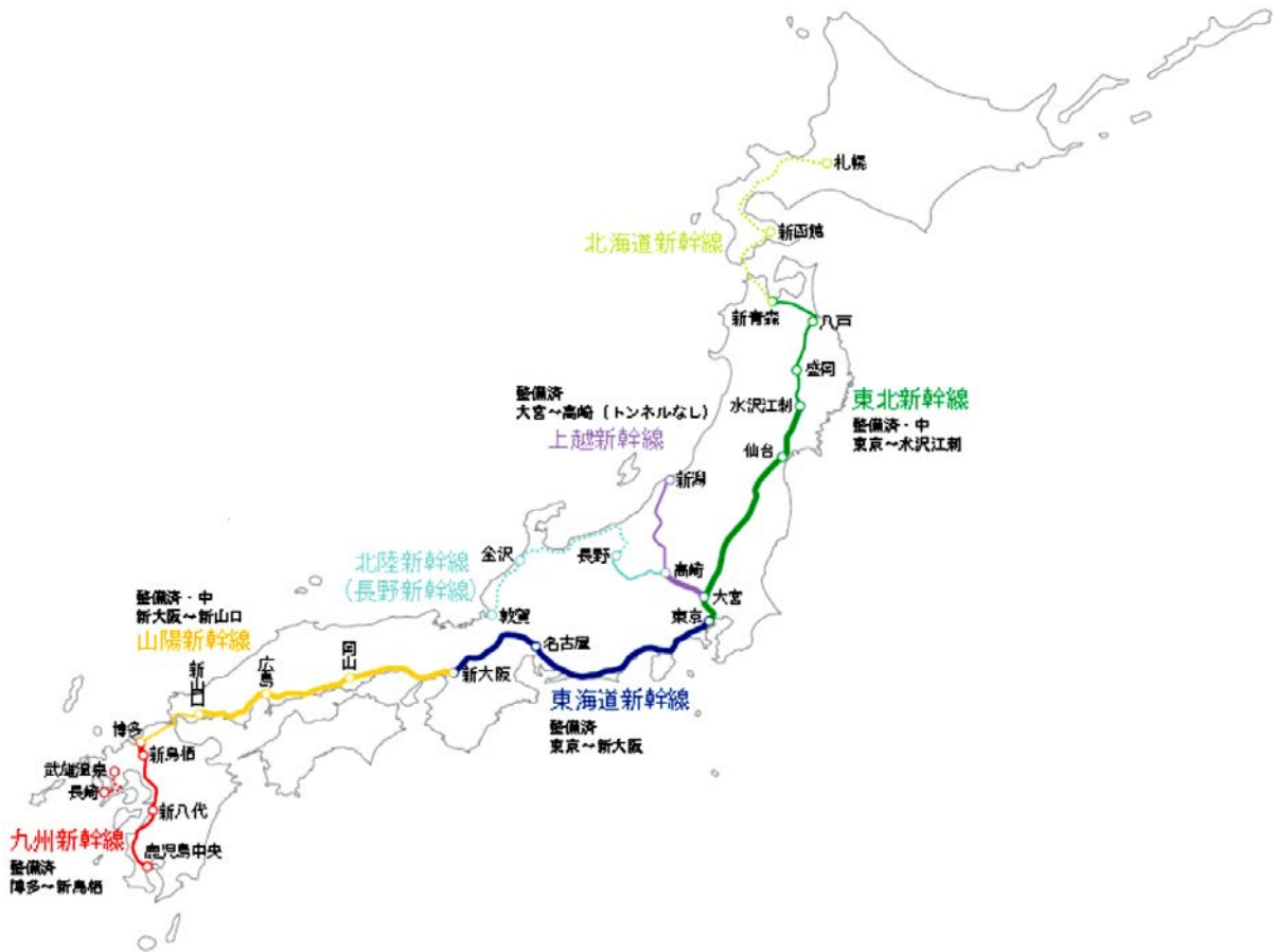
(図表 7) 電波遮へい対策事業の実施状況（過去 10 年）