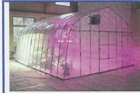
ビニールハウス 5400×4500 (3間×2.5間) 7.5坪