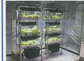
水耕栽培ユニット 2坪(イチゴ) 照明時間 6:00~19:00 電球色・昼光色LED 電圧 200V 電線径 φ100001 x 左側ユニット 緑LED (前夜への風力、生育促進) 照明時間 17:30~20:00