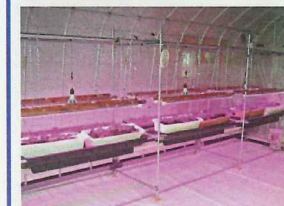
高天井 (イチゴ) 照明時間 6:00~18:00 植物育成用LED 長: 40m 幅: 600m 20W×12本 電線径 φ30001 x 緑LED (前夜への風力、生育促進) 7W×3台 照明時間 17:30~20:00