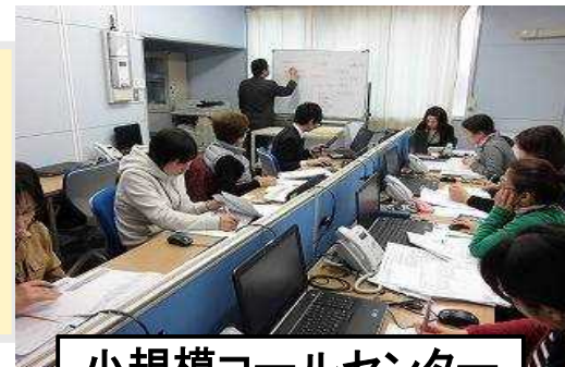
小規模コールセンター 地元雇用(21名) ※ すべて女性