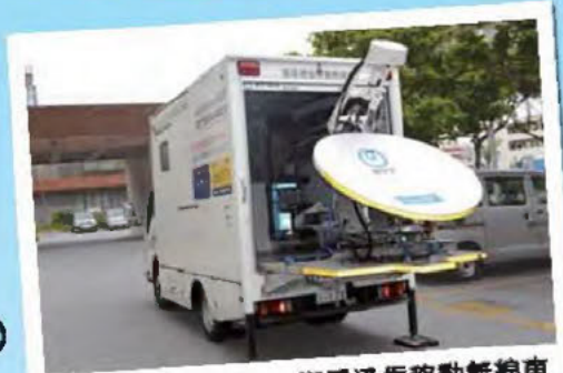
衛星通信移動無線車