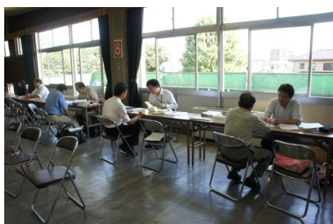
川越一日合同行政相談所