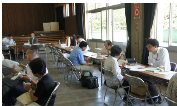
昨年度（川越市開催）の相談所

(受付) 9時 45 分から 15 時 30 分まで (相談対応) 10 時から 16 時まで