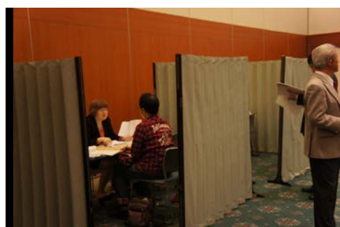
川口一日合同行政相談所

平成 26 年度は、6 月 27 日（金）に所沢市役所で一日合同行政相談所を開設し、以後、10 月 7 日（火）に久喜市、10 月 16 日（木）にさいたま市、10 月 29 日（水）に熊谷市で開設します。