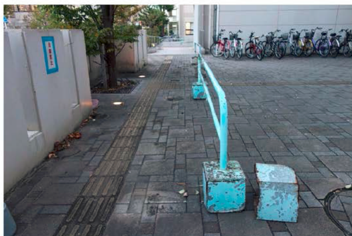
徳島大学は、誘導ブロックの上に置かれていた自転車等を撤去するとともに、学生に導盲方法を指導した。