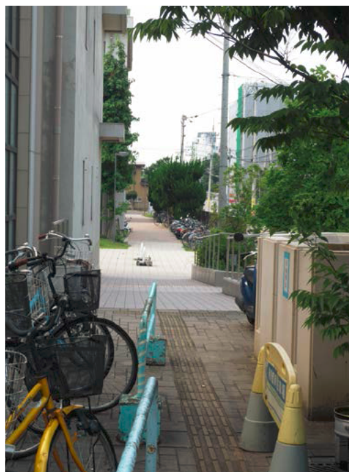
誘導ブロックのすぐそばに柵などが置かれており、接触するおそれがある。