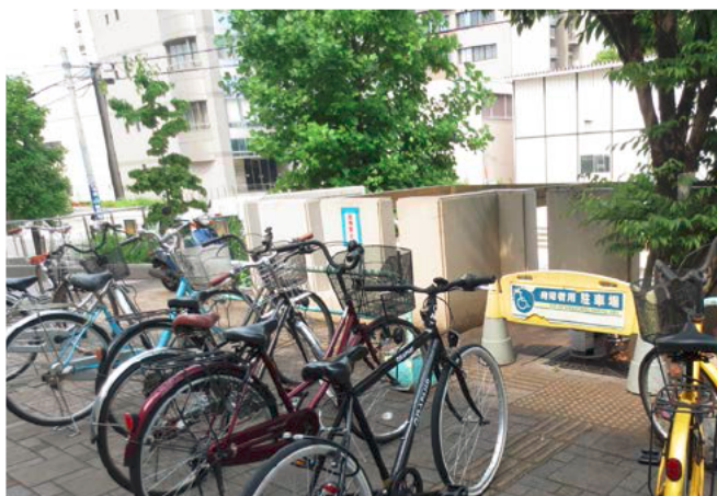
誘導ブロックの上に自転車が置かれている。