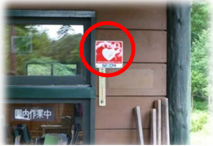
管理棟にAEDを設置している例