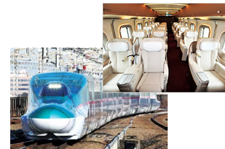
番組で取材する新幹線