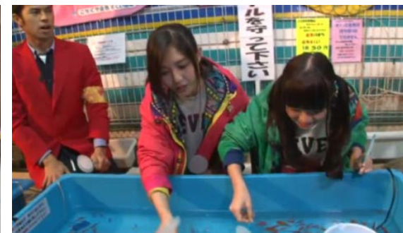
日本での収録模様