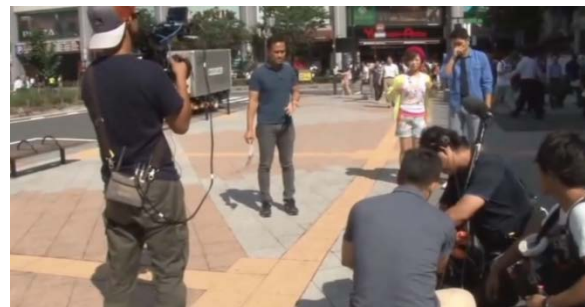
日本での撮影風景