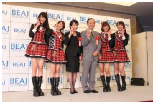
番組企画発表会の模様