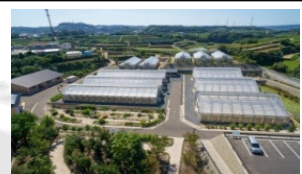
(玄海町:薬用植物栽培研究所)