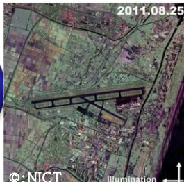
※1 Pi-SAR2による東日本大震災直後の仙台空港付近の撮影画像

※1 合成開口レーダー（SAR: Synthetic Aperture Radar）：地上に向けて電波を放射し、その反射波を受信側の合成開口の信号処理技術を用いて対象物を高い分解能で取得可能なレーダー。