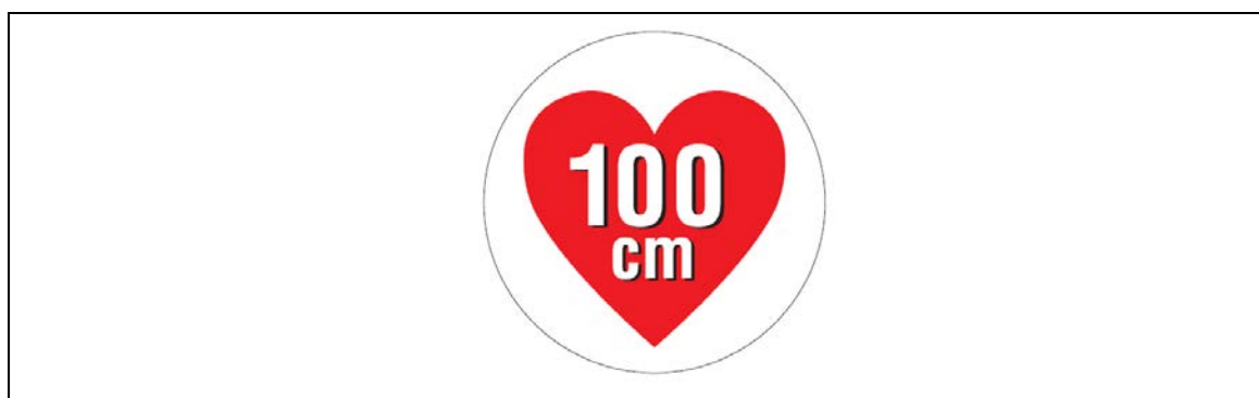
図2 据置きタイプRFID機器（高出力型950MHz帯パッシブタグシステム）用ステッカ

注1： ここでは、公共施設や商業区域などの一般環境下で使用されるRFID機器を対象としており、工場内など一般人が入ることができない管理区域でのみ使用されるRFID機器（管理区域専用RFID機器）については対象外としている。なお、管理区域専用RFID機器については、（一社）日本自動認識システム協会において、一般環境への流出を防止するため、取扱説明書等に注意書きを記載するとともに、管理区域専用RFID機器用ステッカ（図3）を貼付することとされている。