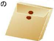
1,000円を超える信書便物