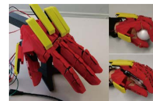
図 3 装着型力覚提示装置