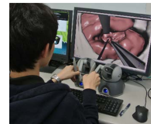
図 1 手術シミュレータ

従来の画面内における仮想現実体験(図 1)では、ユーザの身体と仮想物体との空間的位置関係が整合しておらず、触感も無いため触れたという認識があいまいで、仮想物体の操作は容易でなかった。空中立体映像への直接的なコンタクトと装着型装置による力触覚提示を連携・最適化することで、これまでにない高度なインタフェース技術を実現する。