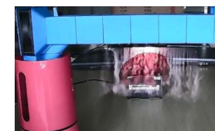
図 2 空中映像表示装置

平成 27 年度には、視覚・力触覚提示装置の連携システムを構築する。現有の空中映像表示装置(図 2)と装着型力触覚提示装置(図 3)に非接触運動計測技術と動力学シミュレーション技術を組み合わせ、空間的・力学的に整合性のある視覚・力触覚の統合的な提示を実現する。平成 28 年度には、平面投影型だった空中映像表示装置を全周から多視点視可能とする。円筒状ミストスクリーンへの多点投影技術とプロジェクタの位置姿勢制御技術を組み合わせ、運動視差(および両眼視差)による立体視を実現する。また、ミストの粒径や発生量による光散乱特性や結像性への影響を解明する。平成 29 年度には、力触覚提示装置のユニバーサルデザイン化とアプリケーションの整備を行う。様々な素材の 3D プリントによりワンモデルで幅広いユーザの手に対応する。また、性能評価やデモ展開のために医療診断や機械設計など実用的で文脈のあるアプリケーションを開発する。