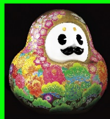
石川県観光 PR マスコットキャラクター「ひゃくまんさん」

「輪島塗」のお髭や「金箔」の体、「九谷焼」の色彩などの伝統工芸や、「石川門」「ことじ灯籠」などの景勝地が全身に描かれ、石川の魅力をギュッと凝縮したデザインのマスコットキャラクターです。