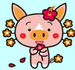
かごしまPRキャラクター「さくら」