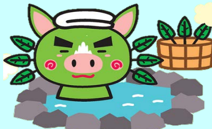
かごしまPRキャラクター「ぐりぶー」