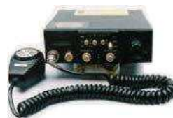
不法市民ラジオ送受信機