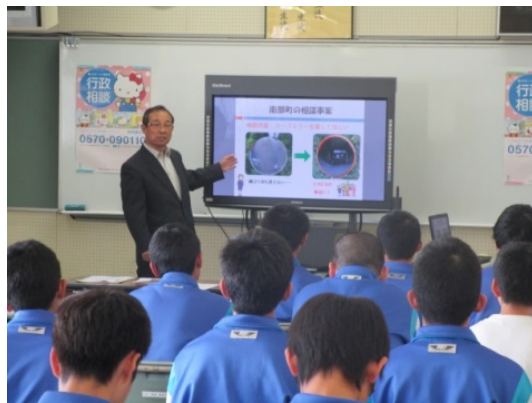
南部町立福地中学校(南部町)