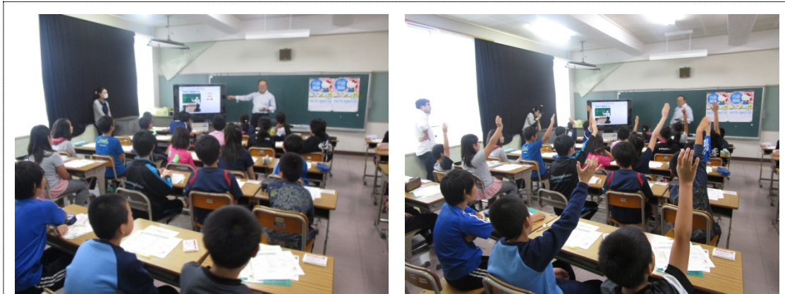
野辺地町立若葉小学校(野辺地町)