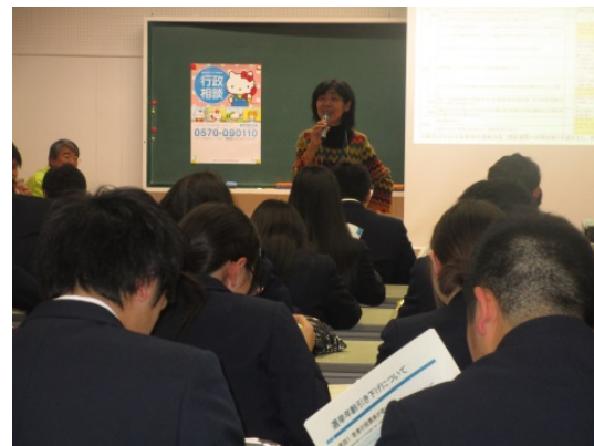
青森県立十和田西高等学校(十和田市)