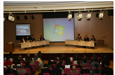
スマホ安全シンポジウム (平成27年2月16日 (奈良県王寺町))