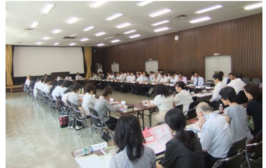
第14回近畿電気通信消費者支援連絡会 (平成27年9月4日: 大阪市中央区)

近畿電気通信消費者支援連絡会を定期的開催し、地域の消費生活センターと電気通信事業者の情報共有を促進するとともに、構成員に対してタイムリーな情報提供を行い、消費者トラブルの解決・解消を図ります。