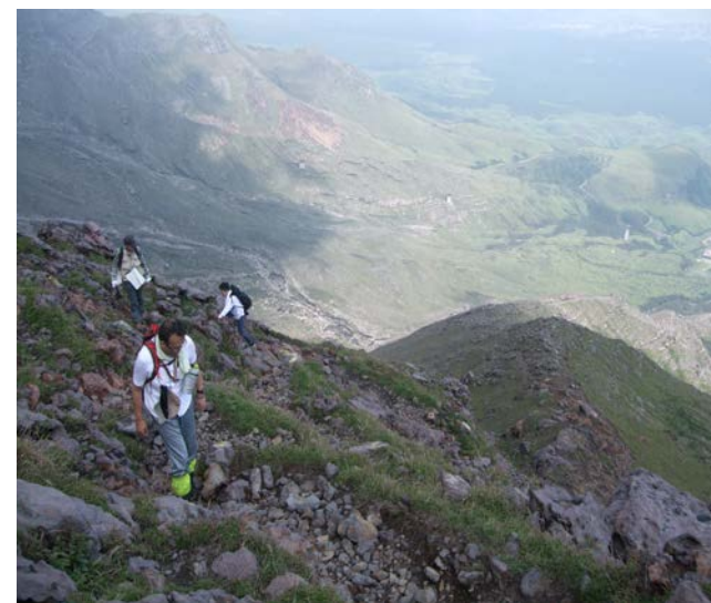
（阿蘇山の現地踏査）