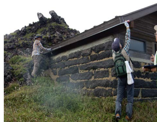
（「月見小屋」の実査（阿蘇山））